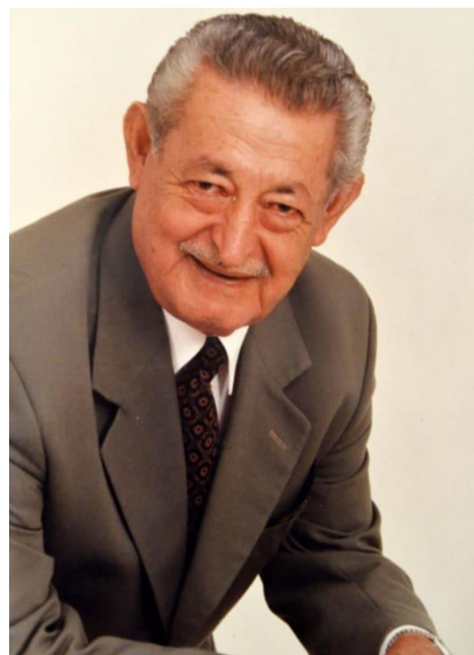
Gupo: KO'E PORÁ (amanecer lindo)

Alejado de los escenarios, Antonio Nicolás Niz considerado "La Guitarra Mayor del Chamamé". Falleció en Corrientes Capital el 30 de agosto de 2010, luego sus restos fueron traídos a Mburucuyá y depositados en el cementerio La Piedad.