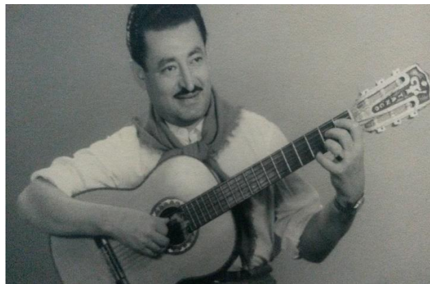
Nicolás Antonio Niz "Guitarra Mayor del Chamamé"

En los últimos tiempos de su exitosa carrera artística, formo con Avelino Flores y Salvador Miqueri, el conjunto "Trébol de Ases" para despedirse de los escenarios hacia el año 2005.