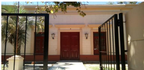
Edificio I.S.F.D Mburucuyá