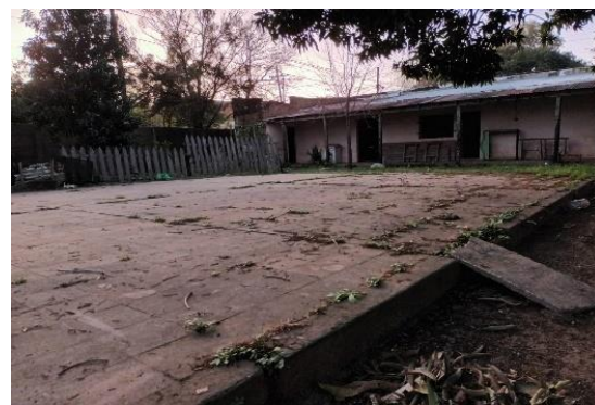
Pista "La Querencia" actual.